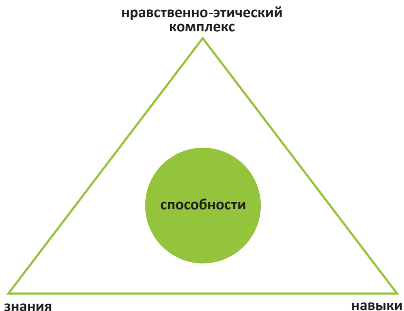
Схема развития компетенций во время подготовки родителей.

При подготовке родителей часто говорят об изучении их мотивации. Мотивация человека, безусловно, связана с удовлетворением его потребностей. Родители с нарушенными, дефицитными потребностями, имеющие зависимое, детское поведение пытаются их бессознательно удовлетворить за счет устроенного в семью ребенка. В процессе подготовки происходит осознание себя, своих намерений и по-